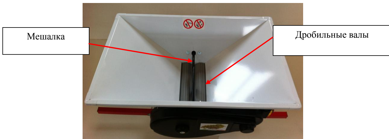
Рисунок 1. Основные составляющие электрической дробилки для винограда.

Над загрузочным необходимо установить увеличитель бункера, который приобретается отдельно.