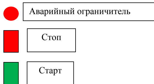
Рисунок 4. Управление прибором.

После дробления виноград готов к брожению.