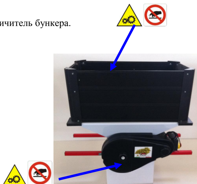
Рис. 2. Опасные движущиеся механизмы